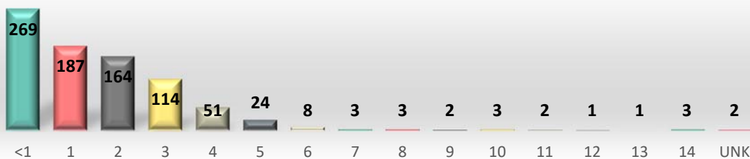
Child Vehicular Heatstroke Fatalities by Victim Age (1990-2017)

Think it can't happen to you... Think again!