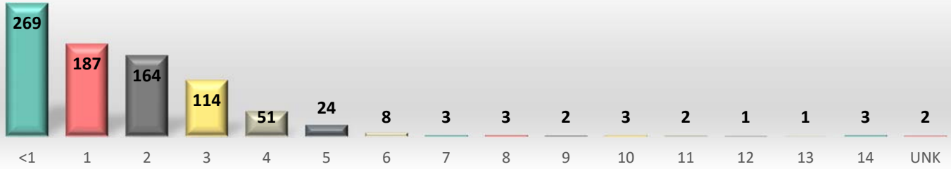
وفيات الأطفال من ضربة شمس المركبات حسب عمر الطفل (1990-2017)